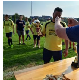
Le capitaine wasmois recevant sa médaille et sa petite coupe