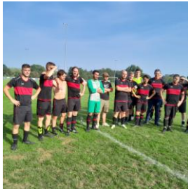
Dynamo attendant patiemment son trophée