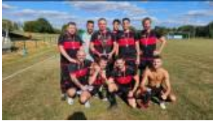
Le valeureux Dynamo