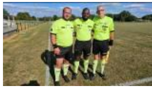
Le trio arbitral