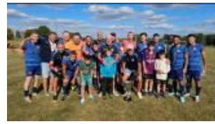
FC Yankee brillant vainqueur